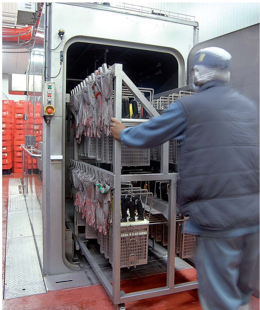
In alto: operazione di carico nel modello cilindrico K5. In basso: armadio KP7.